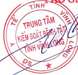
BSCKI. Võ Thế Châu